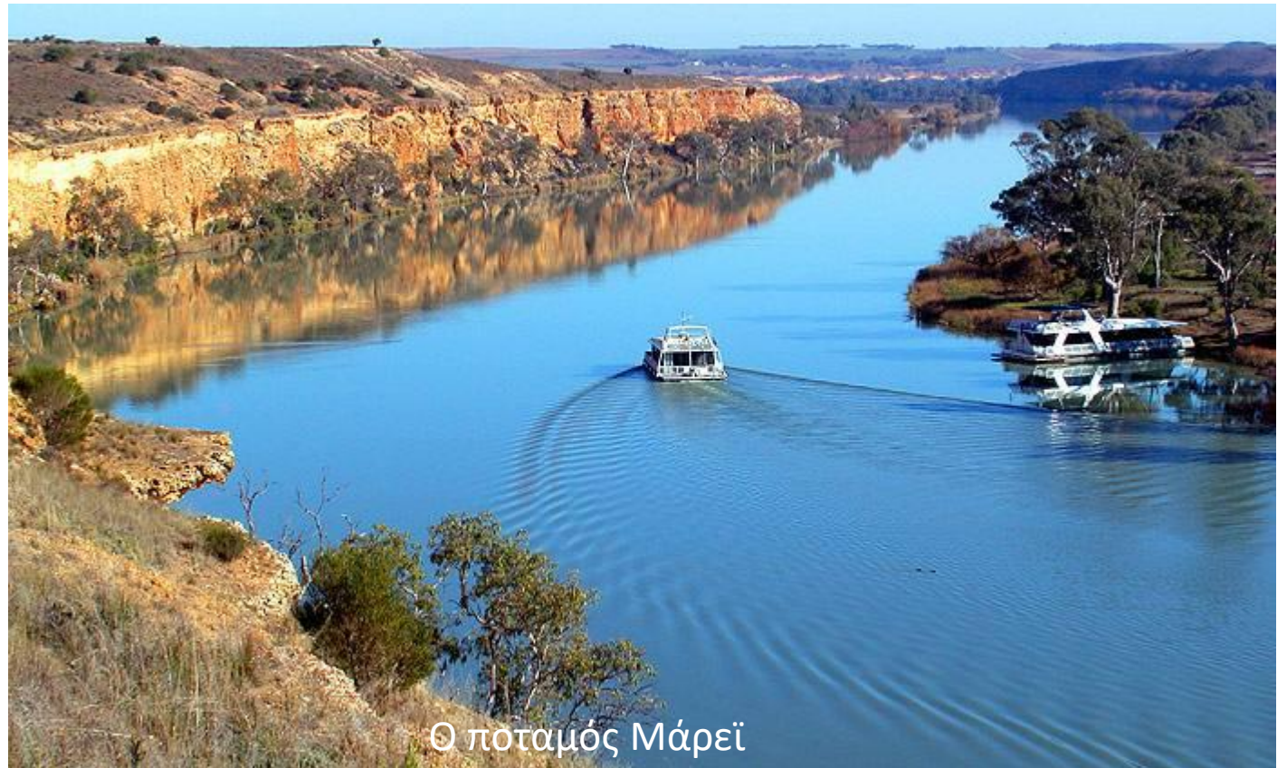
Ο ποταμός Μάρει

Και οι δυο ποταμοί πηγάζουν από τις Αυστραλιανές Άλπεις και κυλούν στις δυτικές πλαγιές αφού οι ανατολικές προς τον Ειρηνικό είναι πολύ απότομες.